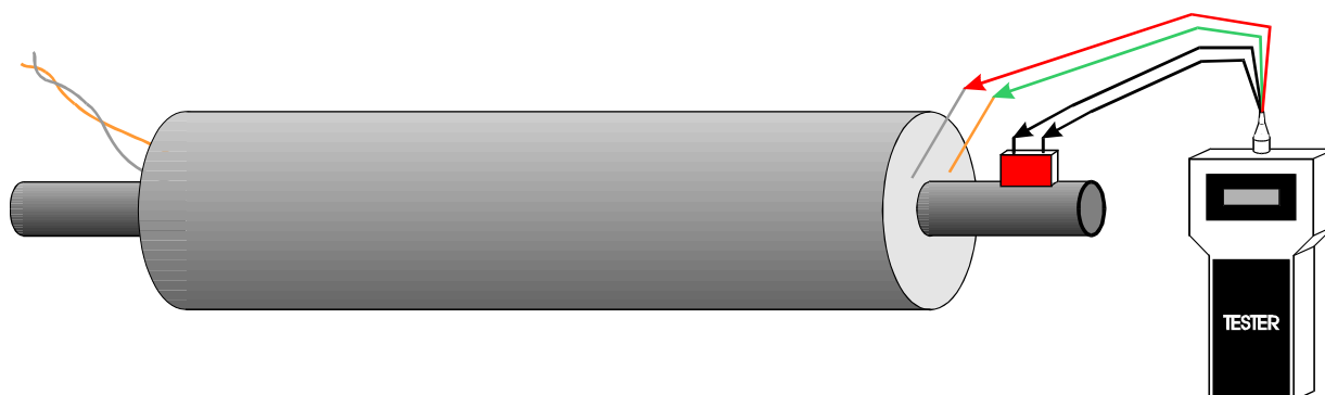
Rys.2 Sposób połączenia przyrządu LX 9024 z obwodem systemu alarmowego

Oprócz informacji pomiarowych wyświetlane są komunikaty tekstowe. Poniżej podano ich treść i wyjaśniono znaczenie.